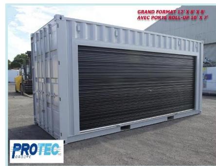
Grand Format "B" - 12' x 8' x 8'H