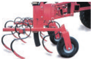
Rampe à maïs avec dents de sarchoir