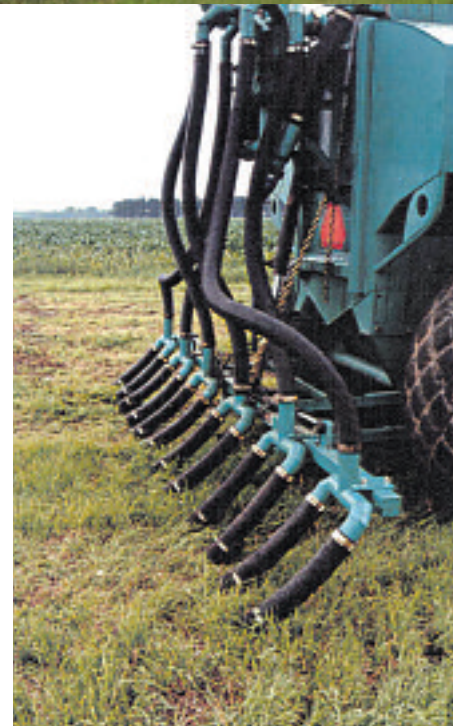
Rampe à prairies munie de pendillards