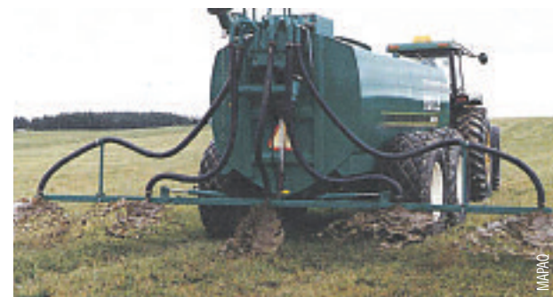
Rampe « pleine terre » conventionnelle