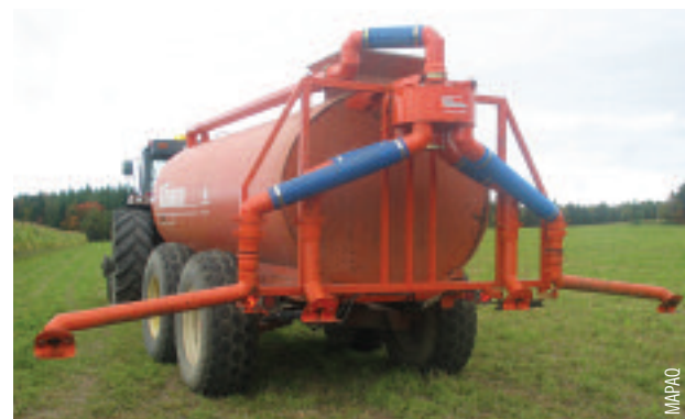
Rampe « pleine terre » nouveau concept