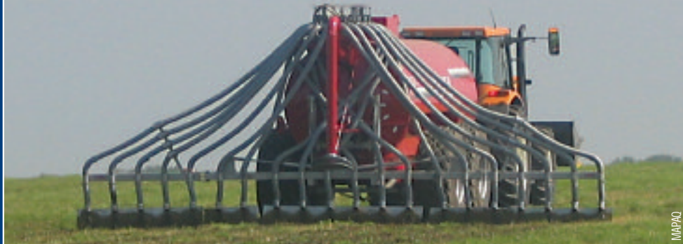
Rampe à prairies munie de tôles applicatrices