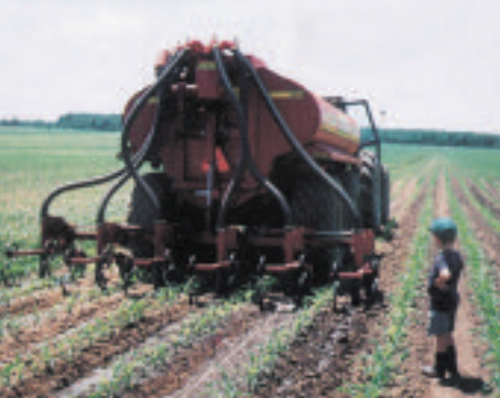
Épandage en postlevée du maïs