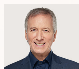
André Lamontagne Ministre de l'Agriculture, des Pêcheries et de l'Alimentation du Québec